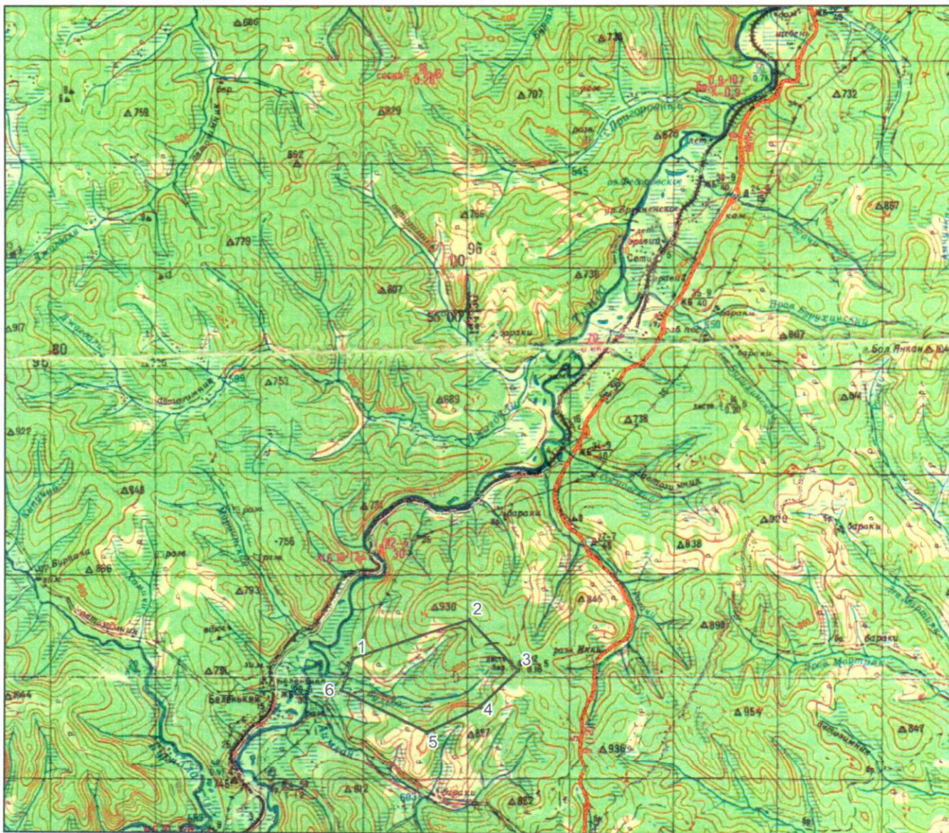
СХЕМА расположения участка недр Бульба (N-51-XI) масштаб 1:200000