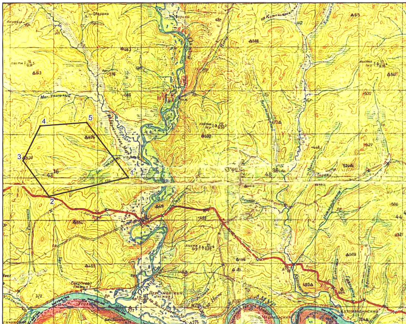
СХЕМА расположения участка недр Большой Увальный (N-51-XXII) масштаб 1:200000